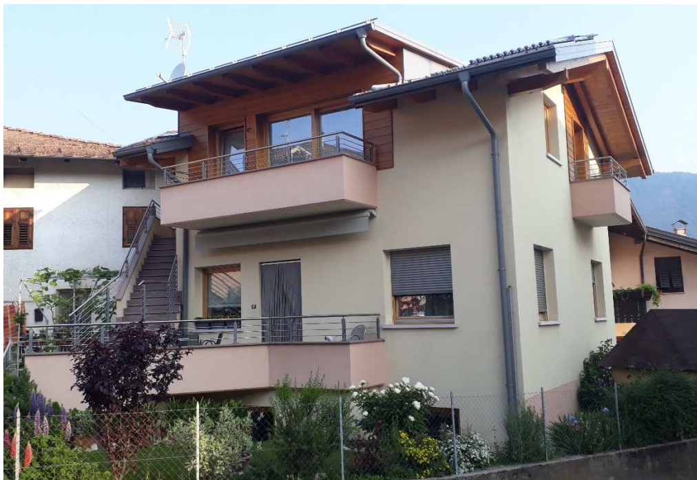
Vista da sud